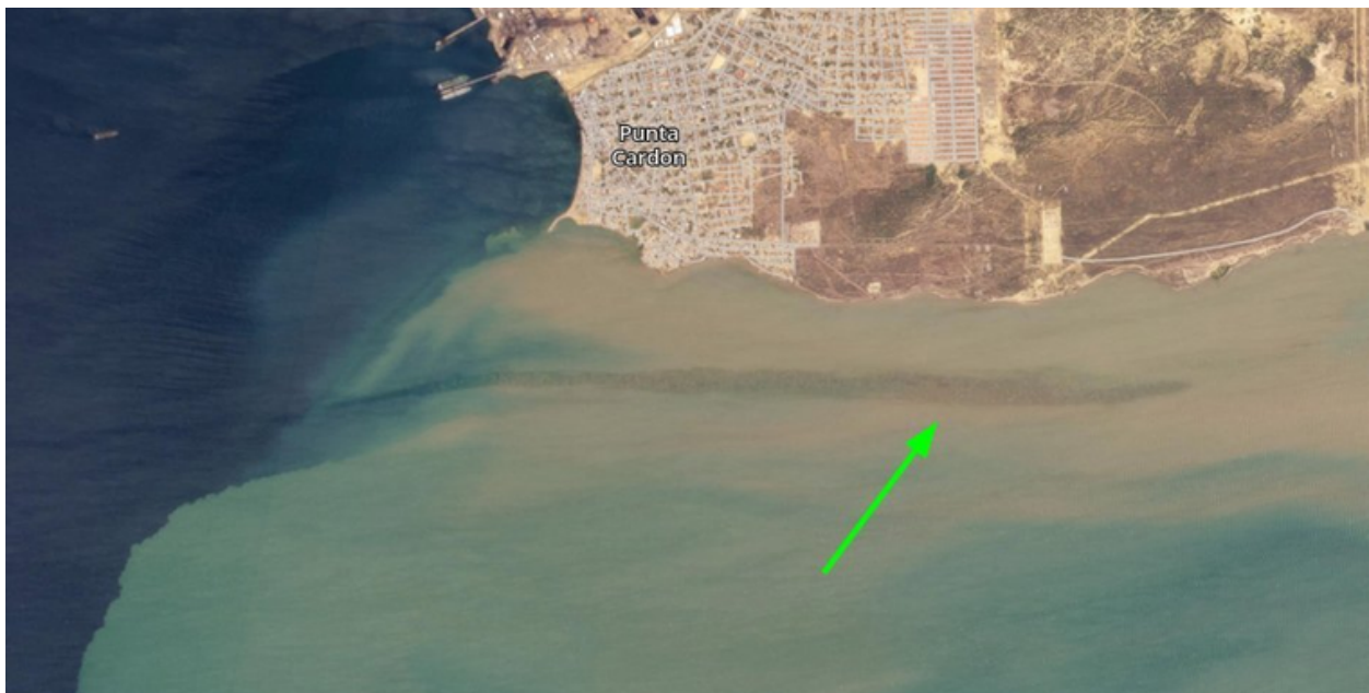
Imagen satelital de derrame de crudo en Río Seco, estado Falcón.