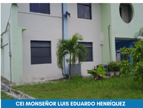
CEI MONSEÑOR LUIS EDUARDO HENRÍQUEZ