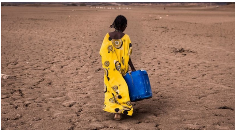
El triple episodio del fenómeno La Niña prolonga las sequías y las inundaciones