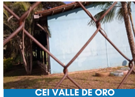
CEI VALLE DE ORO