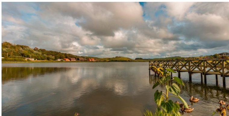
Los lagos del mundo crecieron una superficie similar al tamaño de Dinamarca entre 1984 y 2019