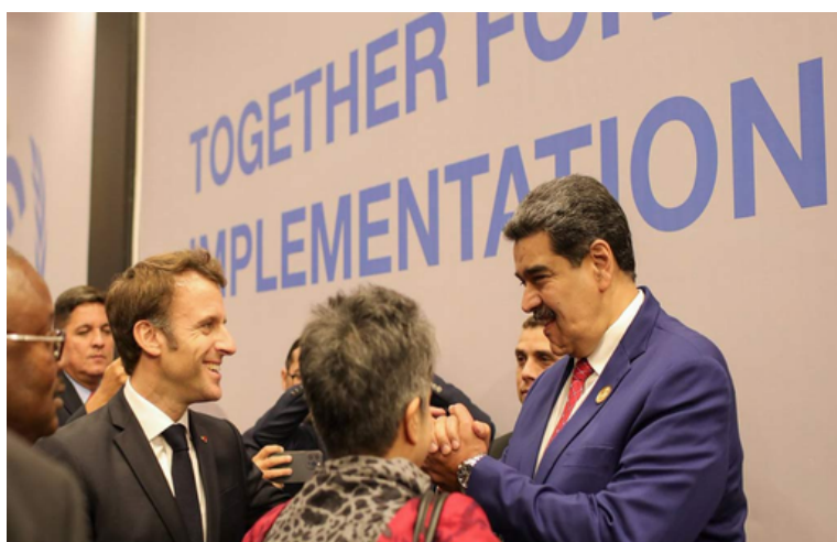
COP27: 5 falacias de la narrativa climática del Gobierno de Maduro