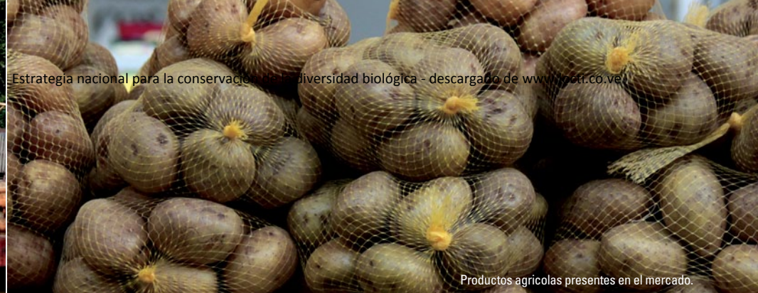
Productos agrícolas presentes en el mercado.