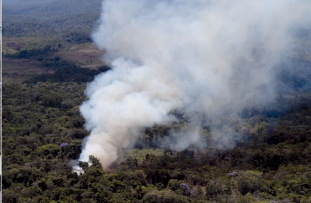
Incendios de vegetación, Estado Bolívar.