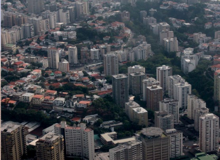
Caracas, Distrito Capital.