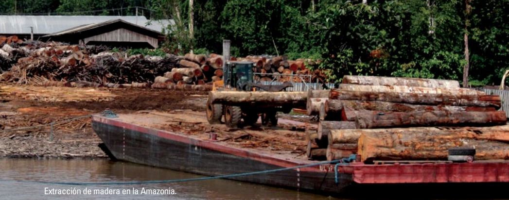
Extracción de madera en la Amazonía.