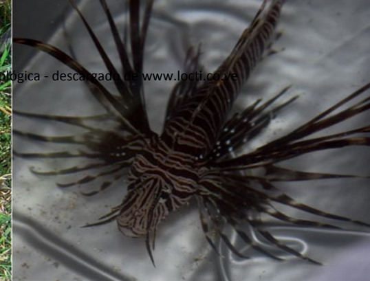
Pez Leon, especie exótica invasora.

El crecimiento desordenado y acelerado de las ciudades es también una de las principales causas de la pérdida de ecosistemas. Las grandes ciudades que destruyen ríos, bosques, sabanas y tierras cultivables, requieren transportar grandes cantidades de agua, alimentos y desechos, generando un impacto ambiental que trasciende la escala local y la propia ciudad.