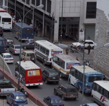
Caracas, Distrito Capital.