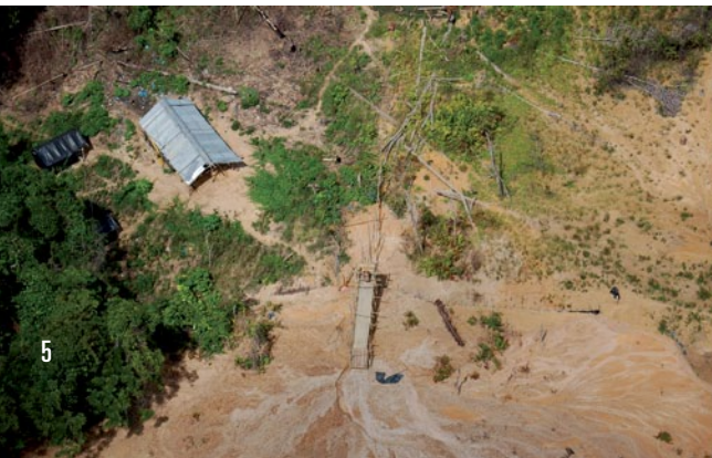
Campo Minero Ilegal, Estado Bolívar