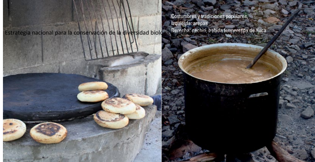
Costumbres y tradiciones populares, Izquierda: arepas Derecha: cachaishi, bebida fermentada de Yuca

La ausencia de las comunidades en la gestión de la Diversidad Biológica ha sido una de las causas del fracaso de la mayoría de las políticas de gestión y de los programas de conservación a nivel mundial. Esta exclusión histórica tiene como consecuencia una gestión ineficaz y una distribución injusta y desigual de los beneficios que se generan de la Diversidad Biológica. La necesidad de participación de las comunidades, incorporando los saberes ancestrales, tradicionales y científicos, mediante un diálogo respetuoso y productivo, en la identificación de problemas y en el diseño, implementación y seguimiento de la gestión ambiental, fue reconocida como un requisito ético y práctico para una gestión ambiental efectiva; cuyo fin debe escapar de la visión fragmentaria, mercantilista y utilitaria, entendiendo a la naturaleza y la sociedad humana como un todo interdependiente para su permanencia en el tiempo.