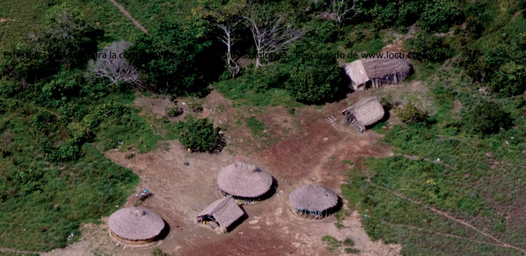
Modelos antagonicos con huellas ecologicas contrastantes. Izquierda: Grandes Ciudades - Derecha: Comunidad Pemón, Estado Bolívar.

Este modelo es sustentado por el patrón de conocimiento hegemónico, en el cual los seres humanos estamos separados de la naturaleza y por encima de ella, justificando las prácticas culturales que atentan contra nuestra Madre Tierra. Este patrón de conocimiento patriarcal, basado en la dominación entre seres humanos y entre los seres humanos y la naturaleza, es anterior al capitalismo, sin embargo dentro de este se articula y se potencia.