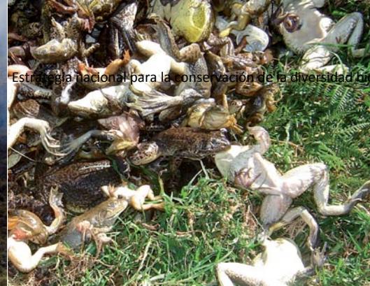
Programa de control de la Rana Toro.