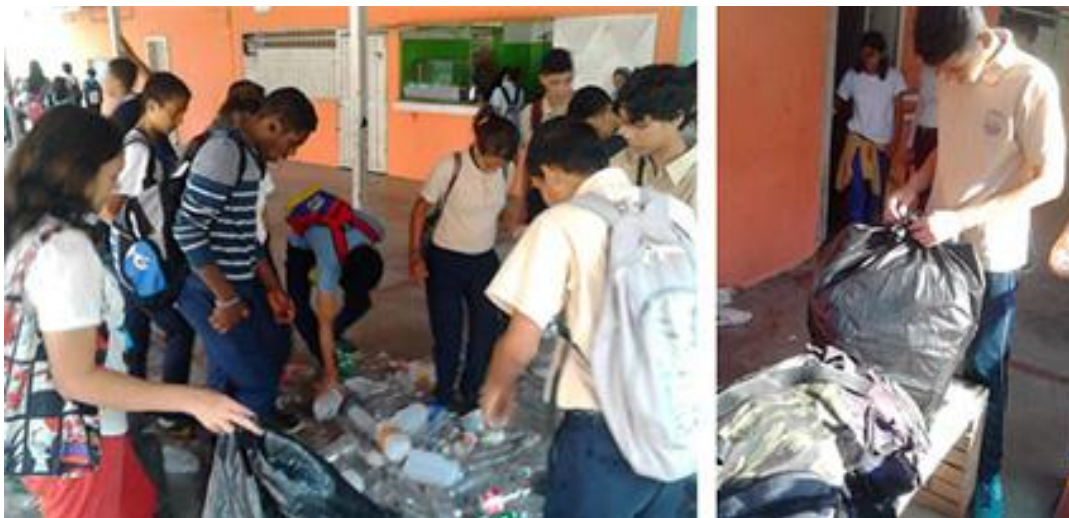
Actividades de mantenimiento en el centro de acopio del Liceo Bolivariano Carabobo.

Mención aparte merece el caso del centro de acopio de la UE Liceo Bolivariano Carabobo, el cual está coordinado y gestionado por un grupo de alumnos voceros de 3er a 5to año de bachillerato, liderado por alumnos de 5to año, quienes asumieron la instalación y manejo del centro de acopio como su proyecto de servicio comunitario. En el caso del Liceo Carabobo, los recursos obtenidos se destinarán a realizar mejoras en la cocina de la institución. Se espera que el punto de acopio instalado en la torre del CC profesional Avenida Bolívar -en la cual funciona la sede de Fundación Tierra Viva en Valencia- funcione como piloto en cuanto al trabajo en condominios comerciales.