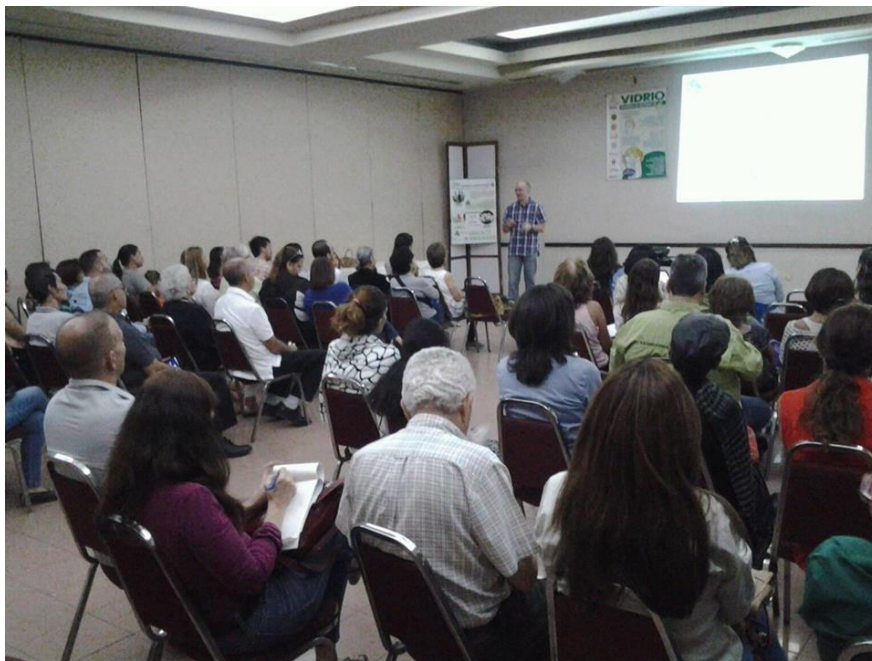
“Condominios Sostenibles: reúso y reciclaje en tiempos de crisis”.