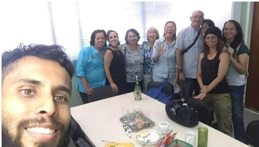
Integrantes del Equipo Acción Ciudadana para el Reciclaje