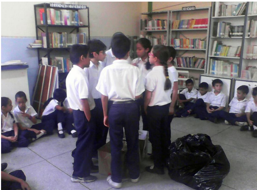
Imágenes correspondientes a la Sala Didáctica en la Escuela Bolivariana Ángel Cervini