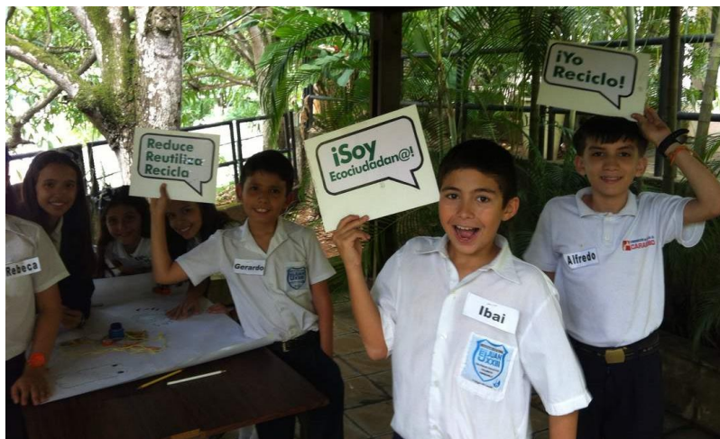
Mesa de trabajo, estudiantes de educación básica