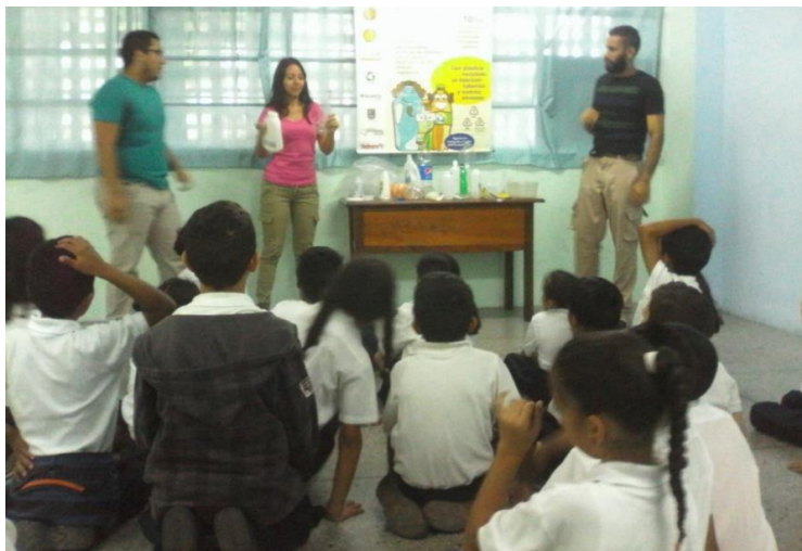
Sala Didáctica en la UE Colegio Lisandro Ramírez