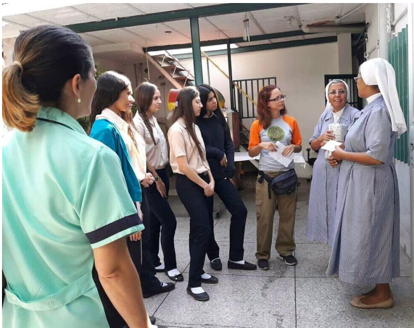
Estudiantes del San Gabriel Arcángel entregando donativo a mojas de la U.E Damas Hospitalarias de San José